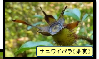
ナニワイバラ(果実)