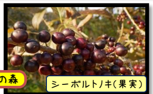
シーボルトノキ(果実)