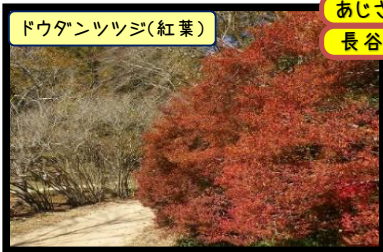
ドウダンツツジ(紅葉)