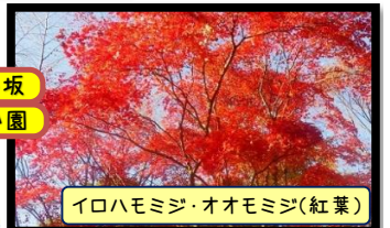
イロハモミジ・オオモミジ(紅葉)