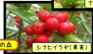
シナヒイラギ(果実)