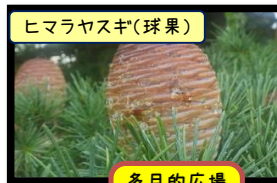
ヒマラヤスギ(球果)