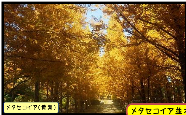
メタセコイア(黄葉)

☆見頃*紅葉*もみじ坂周辺・長谷池・芝生広場周辺・あじさい坂周辺・あじさい園ほか