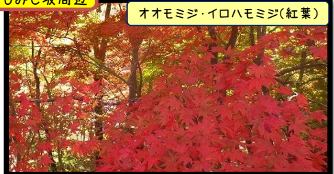
オオモミジ・イロハモミジ(紅葉)